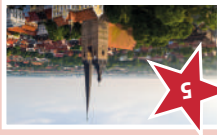
KIRCHE UNSER LIEBEN FRAUEN