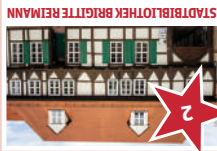
STADTBIBLIOTHEK BRIGITTE REIMANN