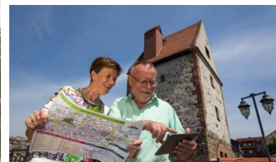
(3) Über 1.070-jährige Altstadt: Oberkirche Unser Lieben Frauen, Hexenturm, Kulturturn