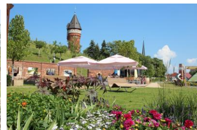
(4) Weinberg – Grüner Stadtbalkon (Teil der Gartenträume – Historische Parks & Gärten Sachsen-Anhalt)