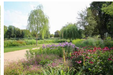
(2) Goethepark und Flickschupark (Teil der Gartenträume – Historische Parks & Gärten Sachsen-Anhalt)