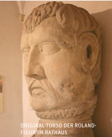
ORIGINAL TORSO DER ROLAND-FIGUR IM RATHAUS

5,60 Meter hoch, 12 Tonnen schwer und mit blankem Schwert in der Hand – das ist der „Roland de Ries“. Burg (bei Magdeburg) ist eine von 13 Rolandstädten Sachsen-Anhalts. Seit dem Mittelalter ist die Rolandfigur Symbol für Stadtrechte und bürgerliche Freiheit.